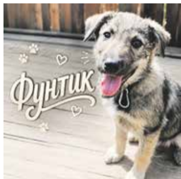
Фунтик – малыш небольшого размера, но с большим сторожевым сердцем. Он первым заметит всё необычное и предупредит вас!