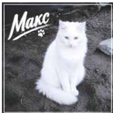
Макс – харизматичный кот с умным взглядом. Он не из тех, кто будет просто лежать на диване: Макс – личность с характером и массой интересных привычек. Если кто-то из этих очаровашек тронул ваше сердце, пожалуйста, звоните. Мы с радостью расскажем о них подробнее и поможем