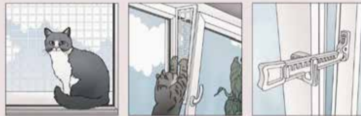
Металлическая сетка АНТИКОШКА. Защитные уголки АНТИКОШКА. Детская гребенка "Baby Safety" с фиксатором.

Внимание! Началось время мучительной гибели и переломов у кошек, выпавших из окна. Ни в коем случае не оставляйте окна открытыми без спецзащиты, если в вашем доме есть животные. Даже на микропроветривание, когда образуется щель! Это очень опасно!