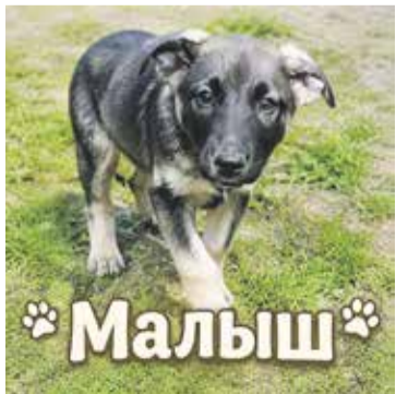
Малыш — душа компании, самый нежный и ласковый щенок. Его объятия и виляющий хвостик согреют в любой день. Макс — харизматичный кот с умным взглядом. Он не из тех, кто будет просто лежать на диване: Макс — личность с характером и массой интересных привычек.