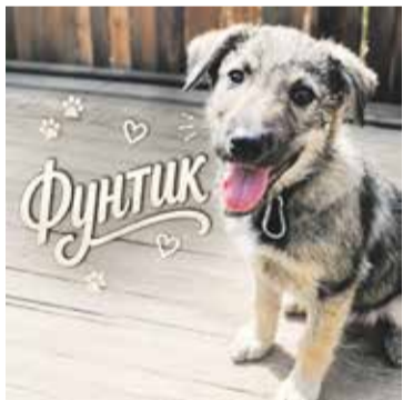
Фунтик — малыш небольшого размера, но с большим сторожевым сердцем. Он первым заметит всё необычное и предупредит вас!