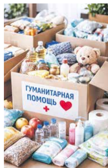
График работы – с понедельника по пятницу с 10:00 до 16:00. Предварительно нужно позвонить по тел. 8-951-920-28-57.