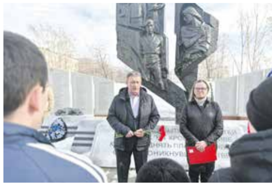
И старшее поколение будет передавать молодому поколению память о подвигах этих ребят.