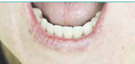
Новый протез, установленный в день операции. Авторство — врач-стоматолог, хирург Дмитрий Александрович Никонов

КАК ЭТО РАБОТАЕТ. Этот метод основывается на установке четырёх имплантов, два из которых располагаются в передней части и два — в боковых отделах челюсти, что обеспечивает одновременно надёжную фиксацию протеза