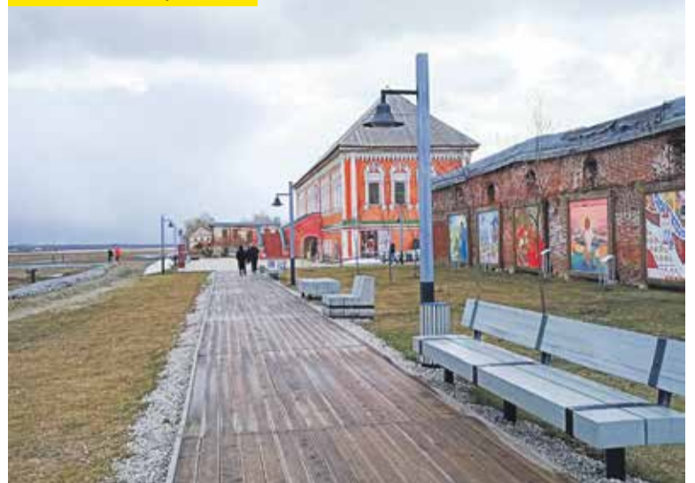
Комплекс «Палаты Строгановых»