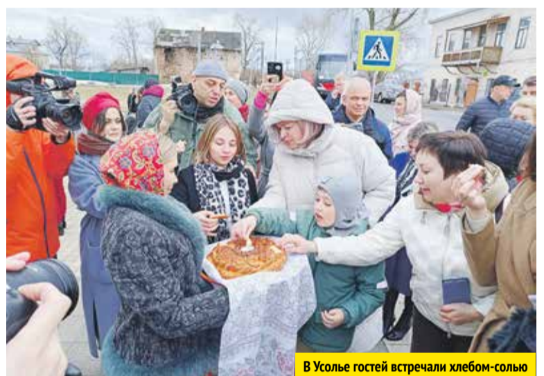
В Усолье гостей встречали хлебом-солью

годска, Усолья, Березников. Не менее насыщенной на события будет и «Строгановская осень». А «Строгановская зима» обещает яркую атмосферу новогодних праздников.