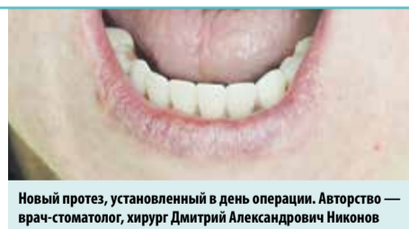
Новый протез, установленный в день операции. Авторство — врач-стоматолог, хирург Дмитрий Александрович Никонов

КАК ЭТО РАБОТАЕТ. Этот метод основывается на установке четырёх имплантов, два из которых располагаются в передней части и два — в боковых отделах челюсти, что обеспечивает одновременно надёжную фиксацию протеза