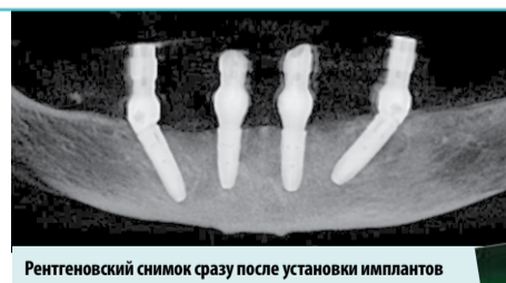
Рентгеновский снимок сразу после установки имплантов

Вживление имплантов и протезирование проводятся под местной анестезией. Процедура не причиняет боли. Уход