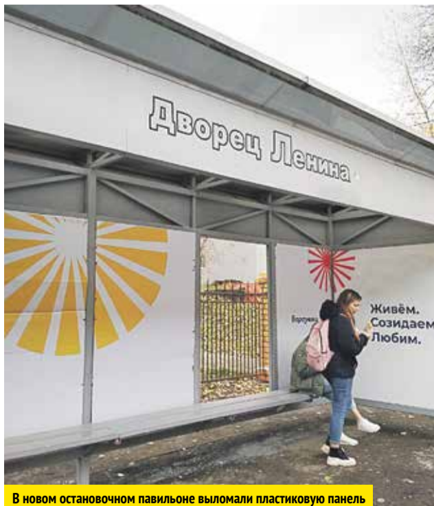
В новом остановочном павильоне выломали пластиковую панель