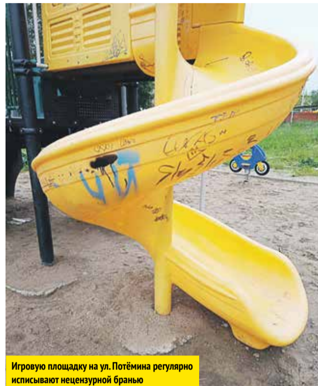
Игровую площадку на ул. Потёмкина регулярно испиывают нецензурной бранью

комплексы. В городском парке культуры и отдыха, Комсомольском парке неоднократно ломали тренажёры, многочисленное количество раз приводили в негодность качели на детских площадках, да так, что после разгрома малолетних хулиганов нормальным детям там играть становится опасно. Отношение к элементам благоустройства городской территории просто поражает, к примеру, сиденье уличного тренажёра в Комсомольском парке спиливали более шести раз! Вандалы-недоучки ломают, спиливают, отрывают и разрисовывают всё подряд. И не только ломают, но и воруют.