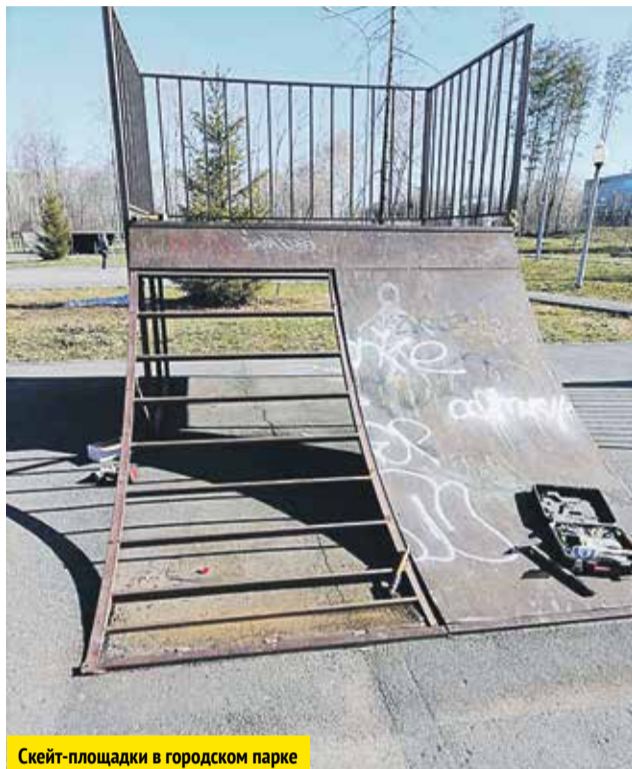
Скейт-площадки в городском парке

Вандалы особенно любят новые объекты. Разбивают светильники и уличные фонари, ломают остановочные павильоны, выводят из строя детские площадки, тренажёрные