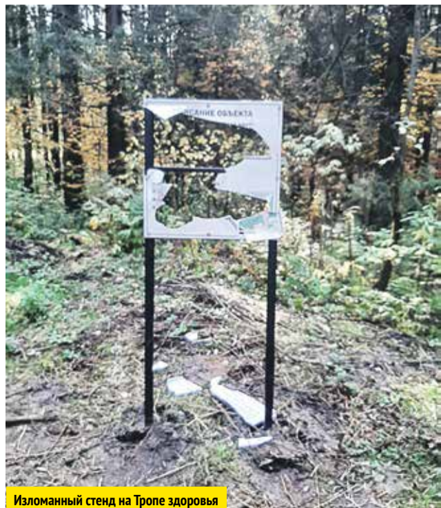
Изломанный стенд на Тропе здоровья