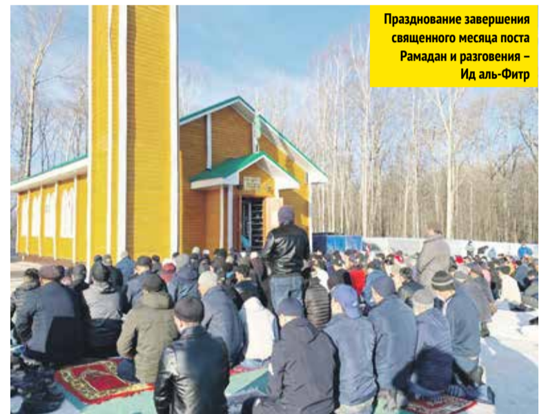
Празднование завершения священного месяца поста Рамадан и разговения — Ид аль-Фитр

Торжественный праздник, посвящённый завершению священного месяца поста Рамадан и разговению — Ид аль-Фитр, прошёл 2 мая в Березниковской Соборной мечети. На праздничные мероприятия пришло более тысячи мусульман.