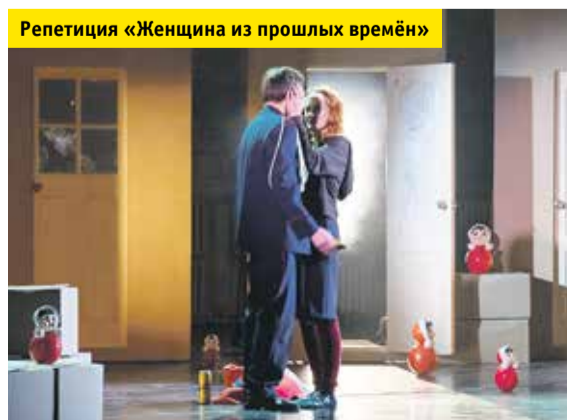
Репетиция «Женщина из прошлых времён»