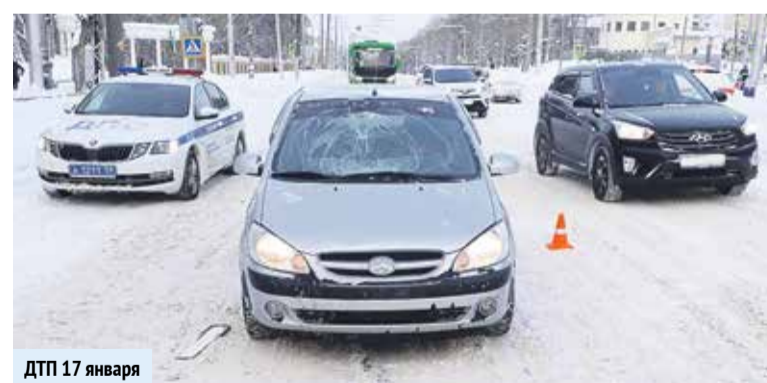
ДТП 17 января

15 января в 9:10 час. в г. Березники местный житель, 1973 г.р., управляя автомобилем LADAXRAY двигался по пр. Советский, в направлении пр. Ленина. По предварительной информации, в районе дома № 16 по пр. Советский данный водитель нарушил п.п. 14.1 (водитель ТС, приближающегося к нерегулируемому пешеходному переходу, обязан снизить скорость или остановиться перед переходом, чтобы пропустить пешеходов, переходящих проезжую часть или вступивших на неё для осуществления перехода), допустил наезд на несовершеннолетнего пешехода — мальчика 2004 г.р. Последний переходил проезжую часть дороги